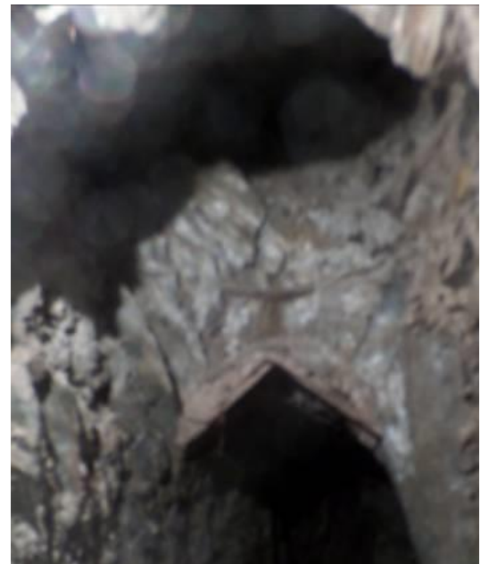
Bas du conduit d'aération

A priori, il n'y a pas d'eau dans le réceptacle, car elle s'évacue au fur et à mesure par la crépine à gauche de l'entrée, placée au ras du fond du réceptacle. Il est possible qu'autrefois il devait y avoir un tube permettant d'atteindre le niveau d'eau désiré, surmonté d'une crépine pour évacuer l'excédent.