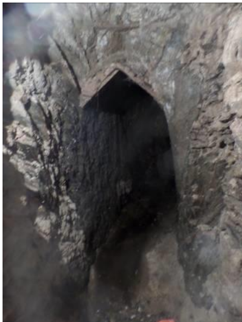
Aspect du réceptacle